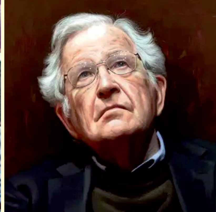
Avram Noam Chomsky

Su libro más influyente, El capital en el siglo XXI , se nutre de datos económicos que se remontan 250 años para demostrar que se produce una concentración constante del aumento de la riqueza que no se autocorrije y que aumenta la desigualdad económica, problema que requiere para su solución una redistribución de la riqueza a través de un impuesto mundial sobre la misma